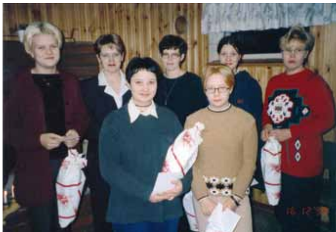
Voimistelijaoston ohjaajia vuonna 1999

Vireä Mixtreeni-ryhmä ja Kankaanpään tenavajumppalaiset esiintyivät Köyliön Lions Clubin järjestämässä nuorison taidetapahtumassa. Valtakunnallisella jumppaviikolla liikuttiin vierailevienkin ohjaajien opastuksella. Aerobicin non-stop-tempauksia järjestettiin nyt kaksin kappalein: keväällä ja ennen joulua.