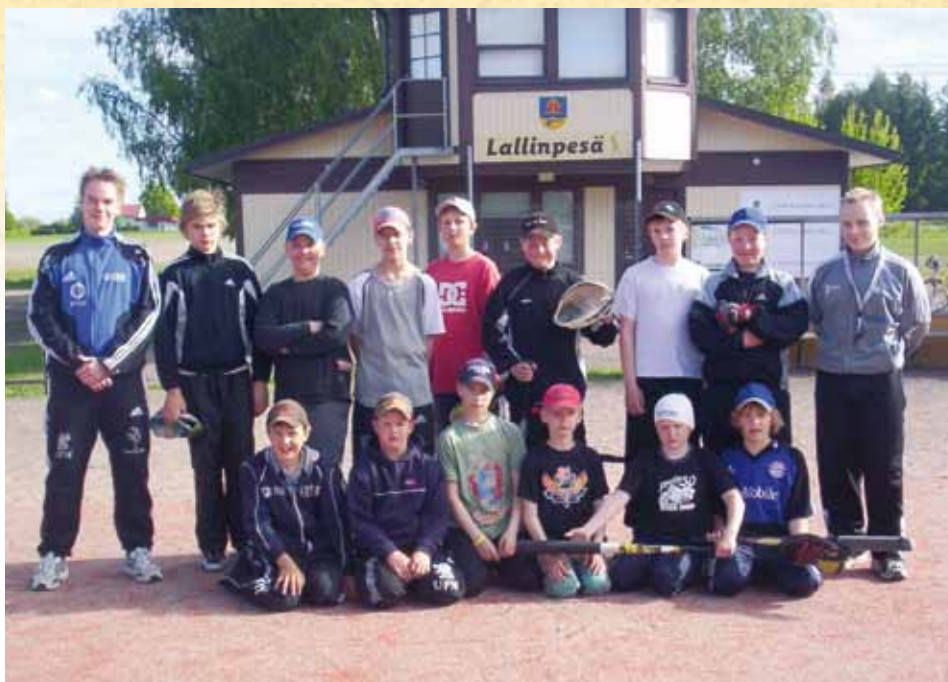
D-94 juniorit 2006

me vuoden 2002 pesäpalloteosta. Varainhankinta vaati entistä enemmän kaikilta, sillä kulut nousevat jatkuvasti.