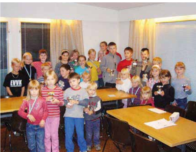
Yleisurheilun sarjakilpailujen palkittuja 2005