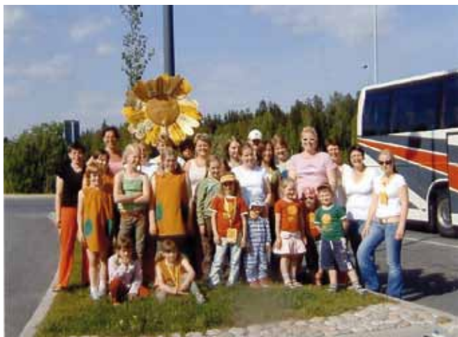
SVOLI-tapahtuman osanottajat kesällä 2006