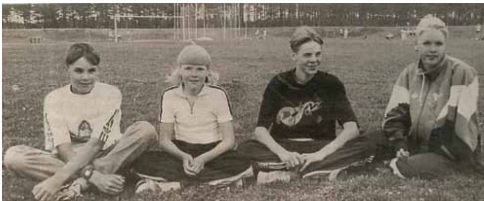
Menestynyt kävelijäperhe Hämläiset

Urheilukoulun pääorganisoijana toimii edelleen kuitenkin yleisurheilujaosto ja muut jaostot tukevat omalla panoksellaan. Urheilukoulukausi ulottuu lokakuun puolivälistä huhtikuun alkupuolelle ja maksullisena kattaa myös sarjakilpailu- ja maastajuoksu-kauden.