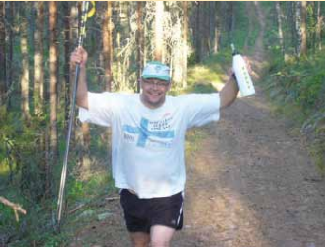
Veteraanien iloista meininkiä