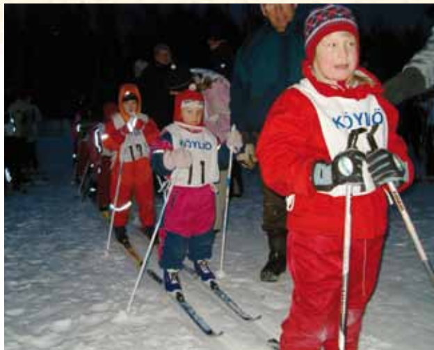
Iltatunnelmaa sarjahiihdoissa 2006

Muuta toimintaa on ollut mm. 2003 vuodesta lähtien osallistuminen urheilukoulun järjestämiseen yhdessä muiden jaostojen kanssa. Kesäisin jaostolla ei toimintaa juurikaan ole ollut. Hiihtojaosto katsoo luotavaisiin mielin tulevaisuuteen. Maastohiihdon suosio ja harrastajien määrä on lisääntynyt huomattavasti kaikkien ikäryhmien keskuudessa.